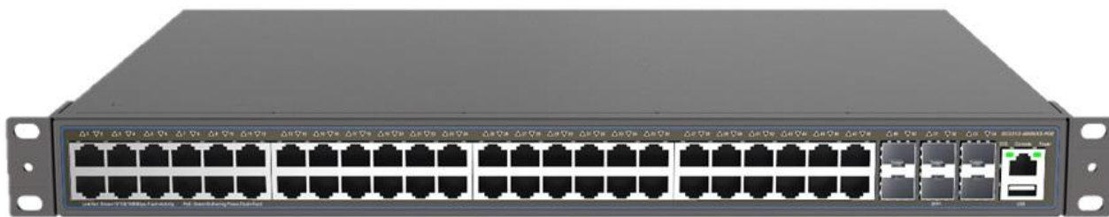
CY5348G-6XS-PWR 万兆三层 POE 交换机