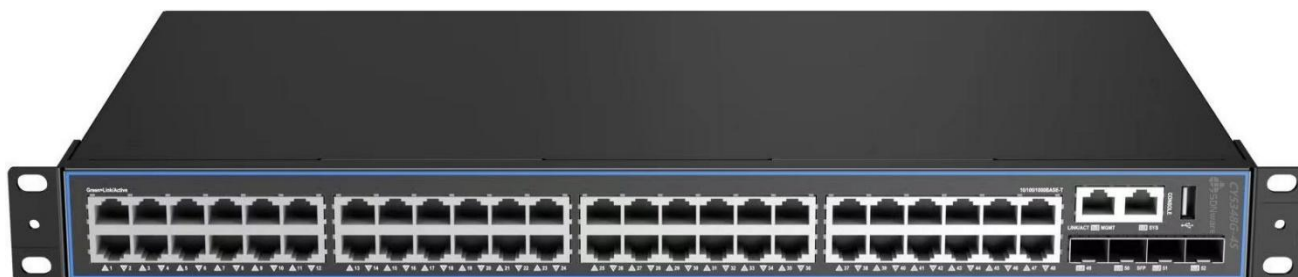
CY5348G-4S 三层 SDN 交换机